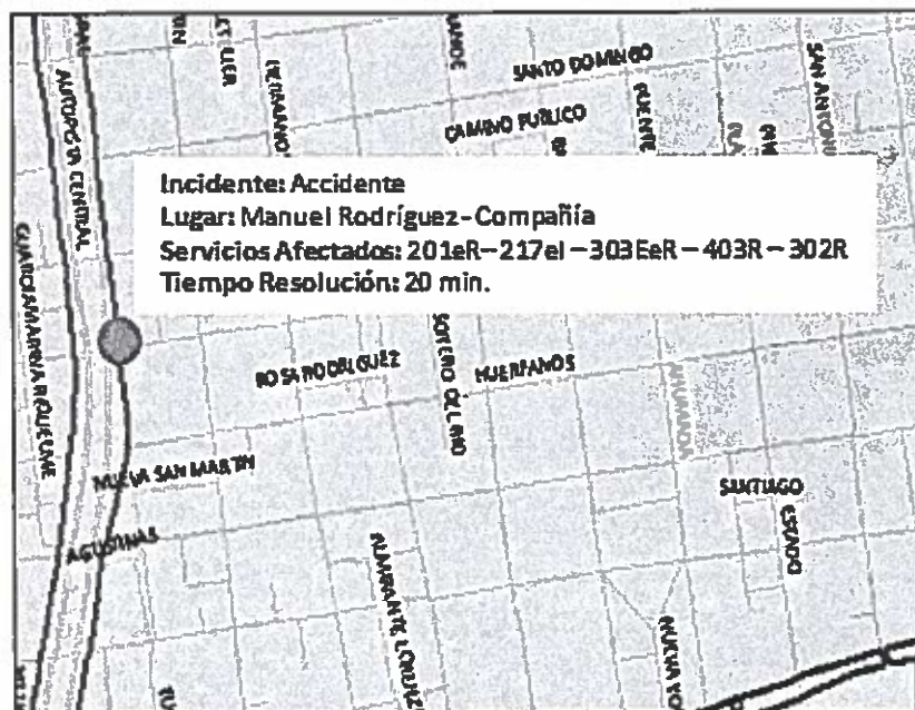
Figura 3: Ejemplo de ventana desplegable de consulta

Consulta sobre componentes del mapa: La interfaz dispondrá de opciones para realizar consultas y obtener información de los elementos del mapa a través de ventanas desplegadas (ver figura 3). Esta acción deberá ser factible tanto para la información visualizada en tiempo real como para la histórica.