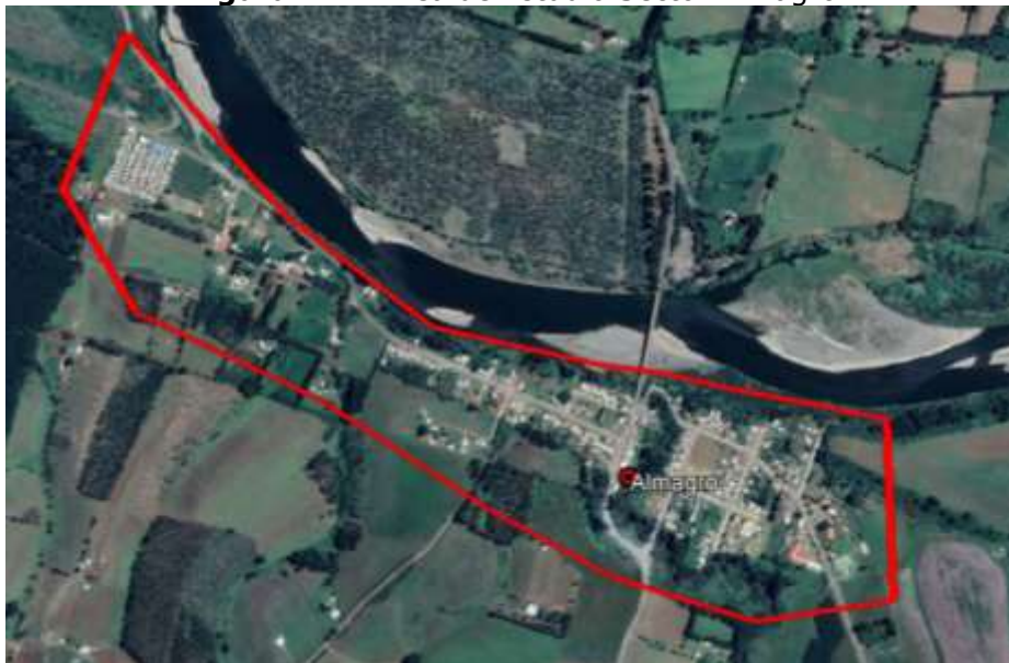
Figura N°2: Área de Estudio Sector Almagro