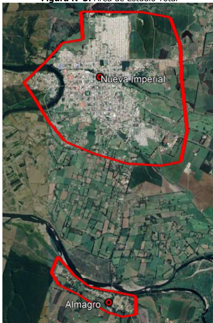
Figura N°3: Área de Estudio Total