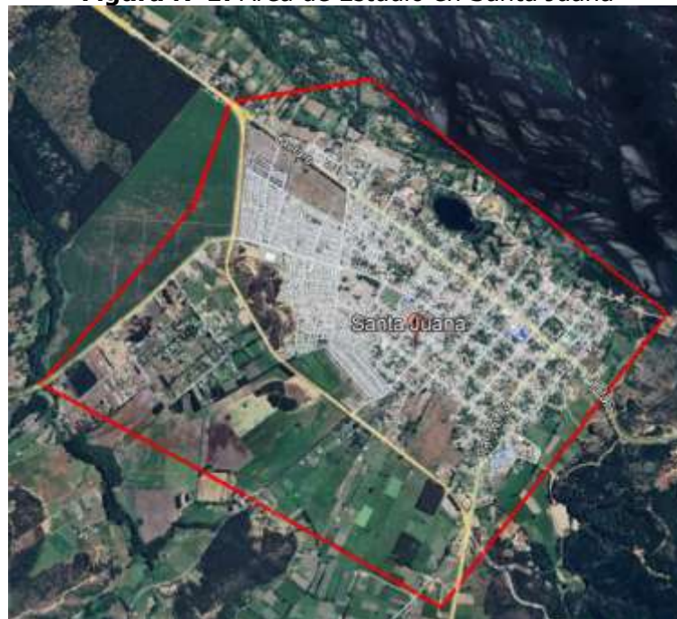
Figura N°1: Área de Estudio en Santa Juana