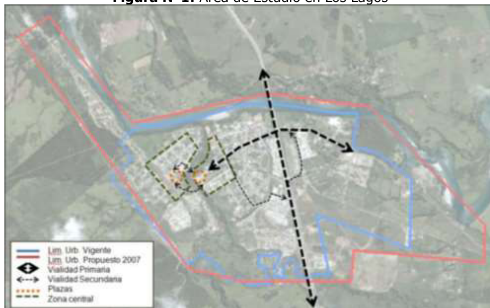
Figura N°1: Área de Estudio en Los Lagos